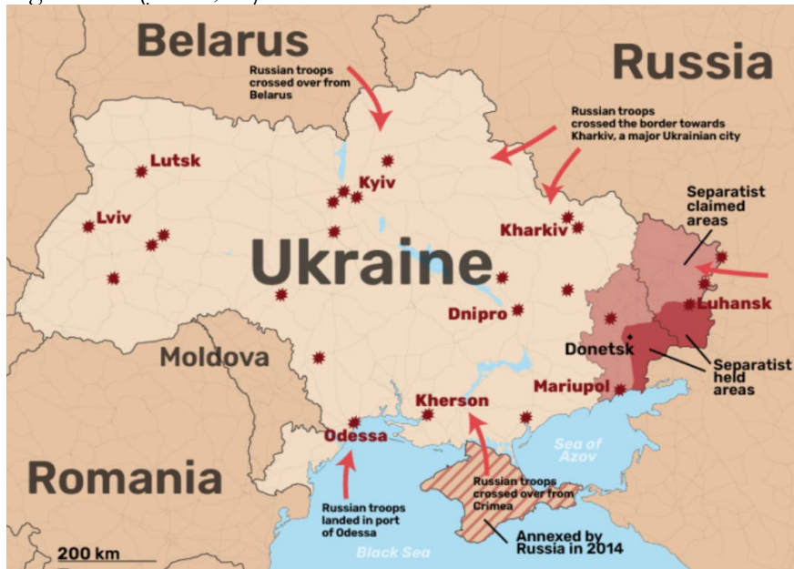
Fig. 1 – Forze divise, scopi divisi